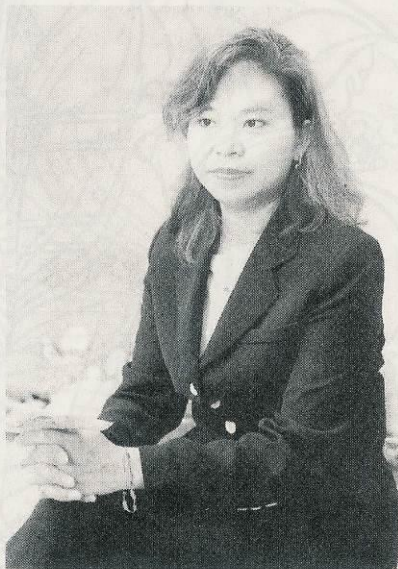
林歐陽婉玲女士有一套課子心經。

直至她也成為人母時，她才正視到母親一職的神聖及凝重，她不願意女兒重蹈自己童年的覆轍，她要女兒