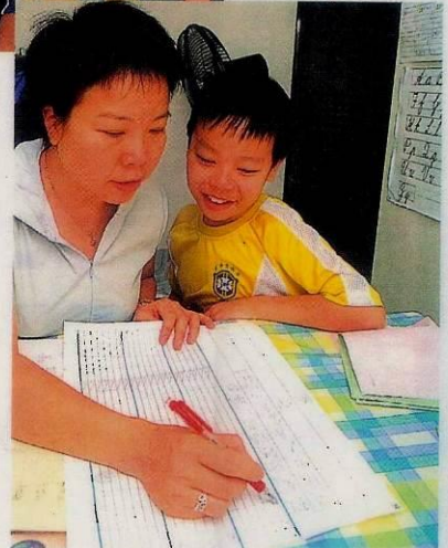
▼ 屈太跟家諾溫習常識生字時，每個詞語會連續3日做讀默，維持他的記憶。